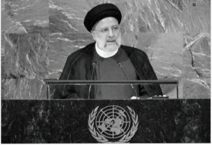
رهبر معظم انقلاب

آمریکا به بحران تصمیم‌گیری خود پایان داده و مسیر صحیح را انتخاب کند. آیتا... رئیسی همچنین از وضعیت حقوق بشر به ویژه حقوق زنان در غرب انتقاد کرد و اظهار داشت: آیا آمریکا که خود بزرگ‌ترین زندان مسادرن در جهان را دارد، می‌تواند صادقانه نگران حقوق زنان باشد؟ گروه مبارزه با مهمی از ایران در جهان سانسور شد و تاکنون چیزی درباره مبعاران شیمیایی مردم ایران گفته نشد که آن سلاح‌ها را برخی اروپایی‌ها به صدام داده بودند، اما در این مدت تصویری که از ایران به جهان مخایره به‌محل حصول سرکوب اطلاعات معتبر و شاعاع اطلاعات نامعتبر بود. وی با تأکید بر اینکه نگاه ما به آینده امیدوارانه است و عدالت جهانی خواهد شد، تصریح کرد: اشغالگری و تروریسم و افراط‌گری از جمله مهم‌ترین تهدیدهای جدی است و ریشه‌کنی تروریست‌ها در گروه مبارزه فراگیر، هدفمند و ریشه‌ای با عوامل اصلی آن و مجازات بدون تبعیض ترویتس‌ها در سراسر جهان است. تنها حکومت مبتنی بر اپراتیاد جهان نمی‌تواند شریک صلح باشد. رئیس‌جمهور کشورمان با تقبیح جنگ‌افروزی در منطقه گفت که گروه‌های حاضر بیگانه از قفزاز تا خلیج فارس نه تنها بخشی از راه‌حل نیست بلکه خود مشکل است و ادامه داد: جنگ راه‌حل موضوع نیست و جنگ در اروپا با سرعت جفوت در مسیر پرهزینه تقابل بازنده خواهند شد. رئیس‌جمهور در ادامه با تأکید بر اهمیت سلاح هسته‌ای هیچ جایگاهی در دکتترین دفاعی جمهوری اسلامی ایران ندارد و گزارش‌های مراجع ذی‌ربط بین‌المللی و حتی جوامع اطلاعاتی غربی نیز بارها صحت این موضوع را اثبات کرده، متذکر شد: جمهوری اسلامی ایران از حق ملت خود برای بهره‌برداری از فناوری هسته‌ای کوتاه نخواهد آمد و وقت آن رسیده است که