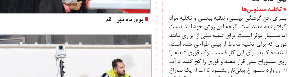
در حاشیه مسابقه پرسپولیس و النصر عربستان