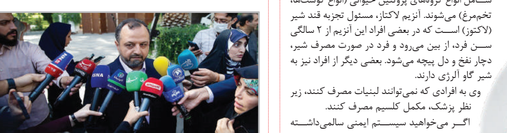
در حاشیه جلسه هیئت دولت