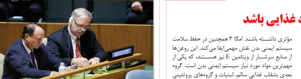
در حاشیه سفرانی رئیس‌جمهور در مجمع عمومی سازمان ملل