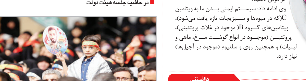
بنیاد طلایه‌داران و فعالان دفاع مقدس با رهبر معظم انقلاب