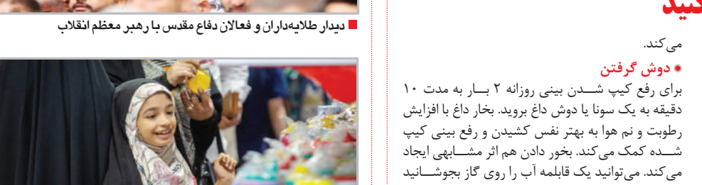
بوی ماه مهر - قم